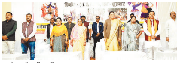
आयोजन में उपस्थित विधायक व अन्य।

जिले में कला, संस्कृति और युवा ऊर्जा का भव्य संगम 5 दिसंबर को झगराखांड में देखने को मिला। जिला स्तरीय युवा उत्सव का आयोजन अबेडकर भवन एवं शासकीय हाई स्कूल झगराखांड में प्रातः 10 बजे से शुरू हुआ। इसमें जिलेभर के प्रतिभाशाली छात्र-छात्राओं और युवा प्रतिभागियों ने काफी संख्या में शामिल होकर अपनी कला, प्रतिभा और रचनात्मकता का मनमोहक प्रदर्शन किया। पूरा परिसर ऊर्जा, ताल, उत्साह और सांस्कृतिक उल्लास से गुंथता रहा।