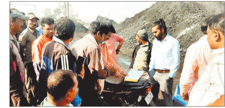
संचालन बिना धूल नियंत्रण के चलाना गंभीर पर्यावरणीय अपराध की श्रेणी में आता है।

करंजी रेलवे साइडिंग से फैलते प्रदूषण, अनियमित कोल परिवहन और ग्रामीणों की बढ़ती परेशानियों को गंभीरता से लेते हुए शुक्रवार को राजस्व विभाग और पर्यावरण विभाग की संयुक्त टीम ने स्थल का आकस्मिक निरीक्षण किया। निरीक्षण ने कई चॉकाने वाले खुलासे किए। कोयले का अवैध भंडारण, बिना अनुमति लोडिंग, पर्यावरणीय मानकों की अनदेखी और धूल नियंत्रण की किसी भी व्यवस्था का न होना पाया गया। ग्रामीणों की शिकायतें सही साबित होने के बाद अब इस साइडिंग को लेकर बड़े स्तर पर कार्रवाई की उम्मीद बढ़ गई है। निरीक्षण टीम के पहुंचते ही साइडिंग परिसर में विशाल मात्रा में कोयले का भंडारण दिखाई दिया।