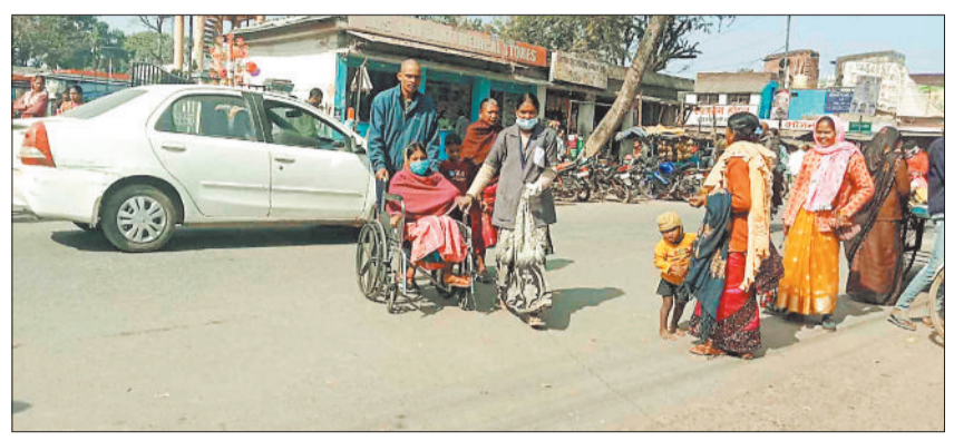
व्हीलचेयर से मरीज को जांच कराने ले जाते परिजन।