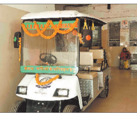
ओपीडी में खड़ी इलेक्ट्रिक वाहन।

व्हील चेयर और स्ट्रेचर से मरीज का जांच कराने को मजबूर परिजन को जांच कराने के लिए दो इलेक्ट्रिक वाहनों की सुविधा उपलब्ध कराई गई है। हैरानी की बात तो यह है कि वाहनों के बावजूद मरीजों का इसका लाभ नहीं मिल रहा। आलम यह है कि वाहन सुविधा नहीं मिलने से परिजन खुद ही मरीज के जांच कराने के लिए व्हील चेयर को धक्का लगाने को मजबूर हैं। मेडिकल कॉलेज अस्पताल में गंभीर एवं सामान्य मरीज के लिए दो अलग अलग इलेक्ट्रिक वाहन है बावजूद इसके मरीजों को वाहनों का लाभ नहीं मिलने से अब वाहन सिर्फ शो पीस बनकर रह गई है। ऐसे में मुख्य मार्ग होने तथा वाहनों के आवागमन करने से हर समय दुर्घटना की संभावना बनी रहती है।